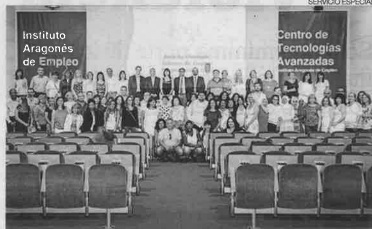
►► Acto de clausura de los talleres de empleo de la Fundación DFA.

A su vez, la directora gerente del Inaem destacó que «el Gobierno de Aragón tiene que tratar de adoptar las medidas necesarias para darles la oportunidad