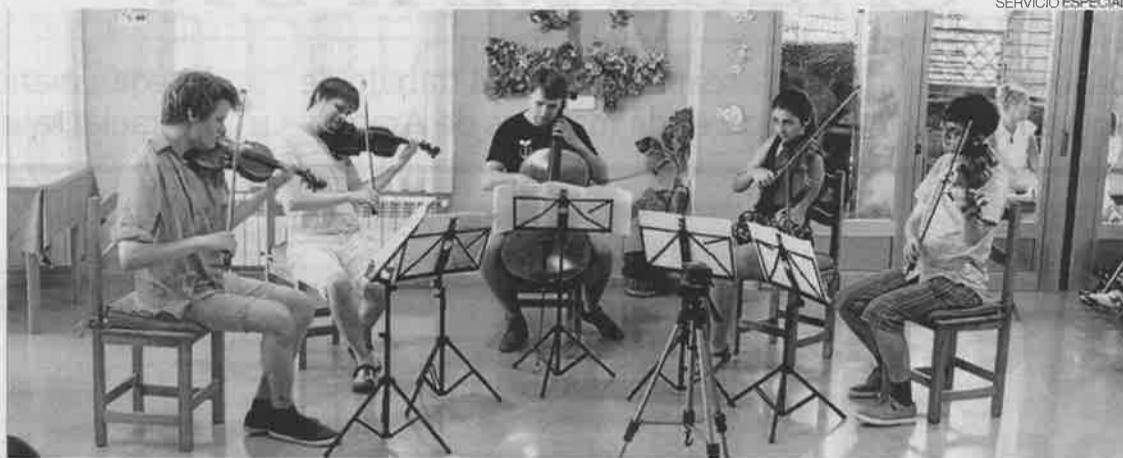
►► Concierto de Musethica en la Residencia Rey Fernando de la Fundación DFA.

Los residentes acogieron con gran entusiasmo la visita anual de los componentes del proyecto, con la que pudieron escuchar grandes piezas musicales de Mozart, Bruch, etc. La primera parte de la actuación tuvo lugar en una sala común donde disfrutaron de temas muy conocidos. La segunda parte, con un compo-